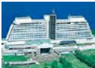
北海道サミット開催地 ウインザーホテル洞爺

※天候および交通機関のやむを得ない事情等によりスケジュールが変更となる場合がございます。予め、ご了承ください。